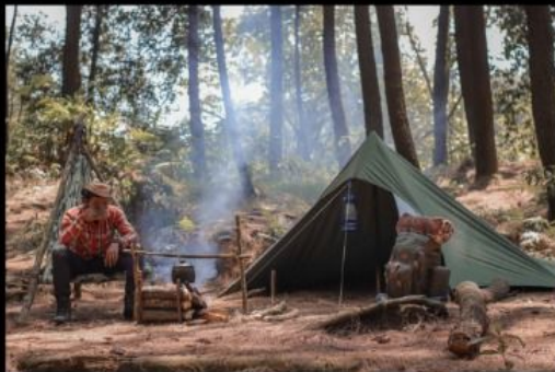
Expedition Robinson Amely Decks