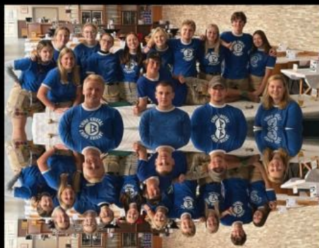
Pensenkermis Chiro Kristal