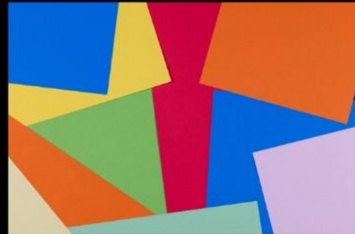
Mastermind Tito The Band