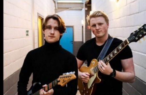
Welcome to the band Kay B