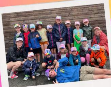
Dag 9: petjes versieren