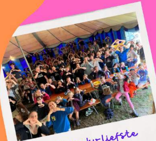
Dag 4: danku liefste kokskes!

In het begin van het kamp kwam ook de oud-leiding op bezoek. Het was echt leuk om iedereen, waar je de afgelopen jaren mee in leiding had gestaan, terug te zien op kamp. 's Avonds hielden we een super leuke zangstonde.