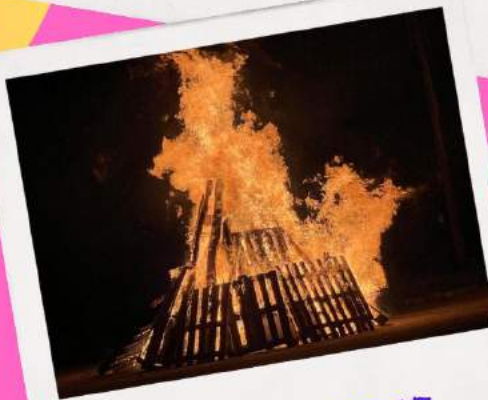
Dag 10: Kampvuur