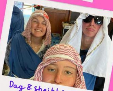
Dag 8: sheikhs van de woestijn