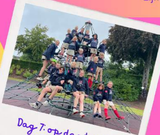
Dag 7: op dagtocht!

De dagen daarna hadden verschillende thema's. Zo hielden we een legerdag, een cowboys- en indianendag, een fata-morganadag, een sportdag en een dag met alle kleuren van de regenboog. Met de dagtocht gingen we zwemmen in het binnenzwembad van Saint-Vith.