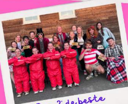
Dag 2: de beste leidingsploeg

Graag wil ik iedereen bedanken voor dit bangelijke Chiro-avontuur.