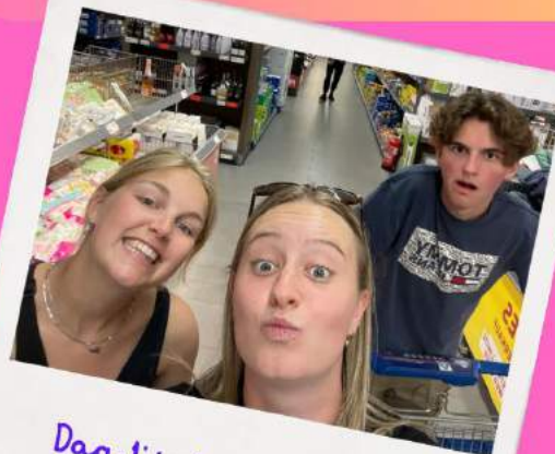
Dag 1: inkopen doen