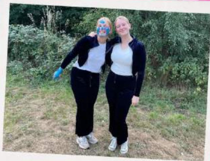
Dag 6: Violet wordt een boskes